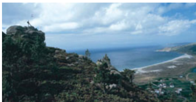
Cumbre de la Pena de Mórdomo.

Primero subimos hacia una roca puntiaguda y buscando el paso más evidente entre los bloques, nos dirigimos, con precaución, hacia la cumbre.