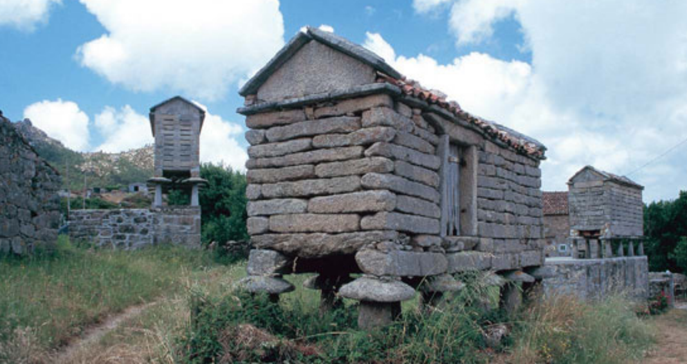
Hórreos de Mórdomo en el inicio de la ruta.