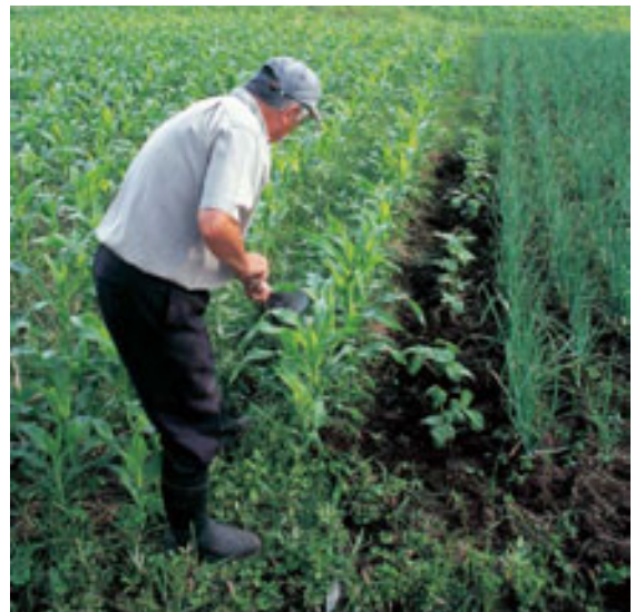
Fértil huerta de Mórdomo.

En las últimas casas dejamos hacia la izquierda un camino de tierra que conduce a O Castro y Socasas y subimos recto por un camino cementado que al poco (ante una nave) dejamos para subir hacia la izquierda (km 0,3 / alt. 24 m) en dirección hacia la Pena do Mórdomo.