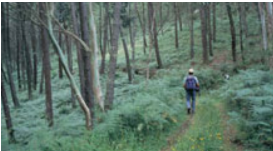
El camino hacia la Pena nos introduce en un bosque tapizado de helechos.

En Mórdomo, junto al bar Os Espiños, subir por la calle de la izquierda, en dirección a la Pena do Mórdomo, que vemos arriba. A la derecha vemos también la Peña Orelluda, con su particular forma cuadrada.